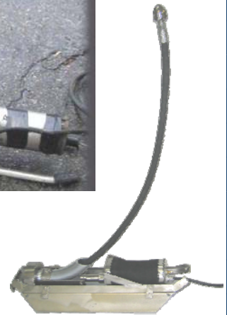
Launcher latéral pour conduite de 8' à 18'

Cet appareil a été utilisé pour nettoyer des conduites de 4" à plus de 60 pieds du branchement à partir de la conduite maîtresse.