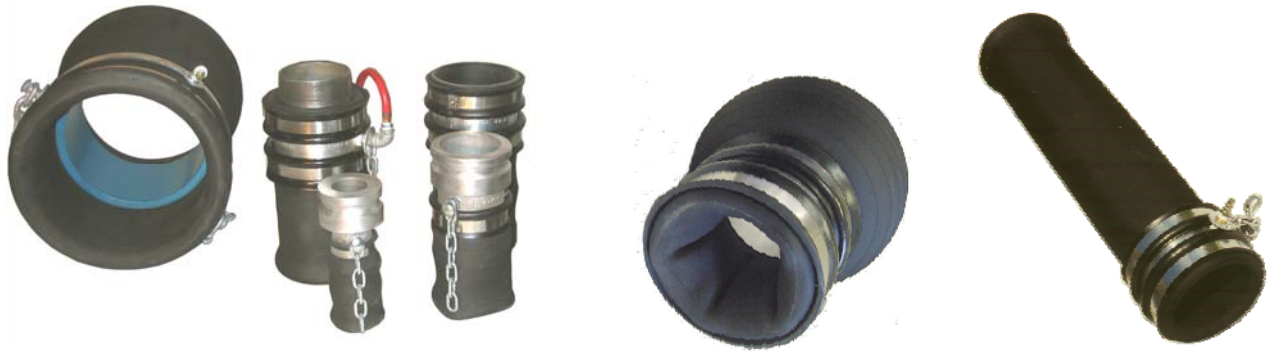
Une de ses applications